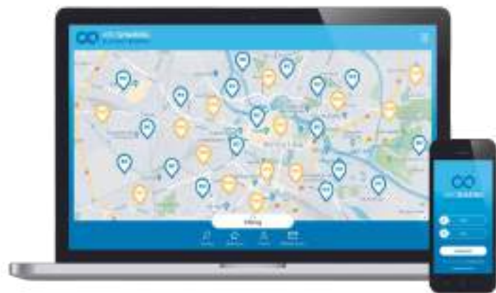
lokalny bank non-profit