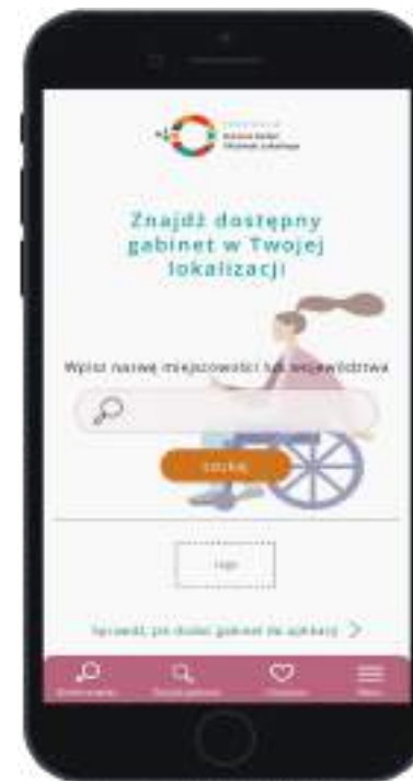
ginekologia / andrologia